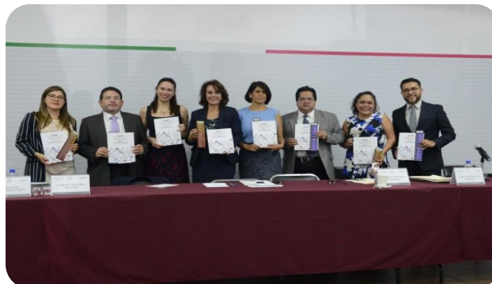
Presentación de la "Guía para la atención de la violencia política por razones de género y derechos humanos en la Ciudad de México", 11 de junio de 2018

Por otra parte, el pasado 11 de junio, se presentó la Guía en las instalaciones del Instituto Nacional de Desarrollo Social (INDESOL), por parte del Instituto Electoral de la Ciudad de México, el Tribunal Electoral de la Ciudad de México, la Procuraduría General de Justicia de la Ciudad de México, la Comisión de Derechos Humanos del Distrito Federal y el Instituto de la Juventud de la Ciudad de México ante Organizaciones de la Sociedad Civil, e Institutos de las Mujeres de la República, principalmente.