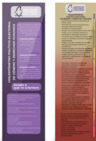
"Violentómetro político-electoral en razón de género y derechos humanos"

En el marco de la presentación de la "Guía para la atención de la violencia política por razones de género y derechos humanos en la Ciudad de México", el 4 de abril se presentó en público el "Violentómetro político-electoral en razón de género y derechos humanos", en el Instituto Nacional de Estudios Históricos de las Revoluciones de México, con el fin de hacer difusión de una herramienta de sensibilización respecto a los diversos niveles de violencia política por razones de género y violencia simbólica que se ejerce en contra de las mujeres durante los procesos electorales. En dicho evento se repartió el Violentómetro diseñado en formatos tipo separadores y reglas y se difundió con banners.