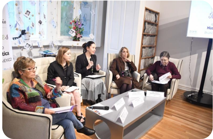
Conversatorio "Mujeres que han hecho historia política en la Ciudad de México"

Eje de acción c. Observar los procesos institucionales que favorezcan la participación y representación de los grupos susceptibles de discriminación.