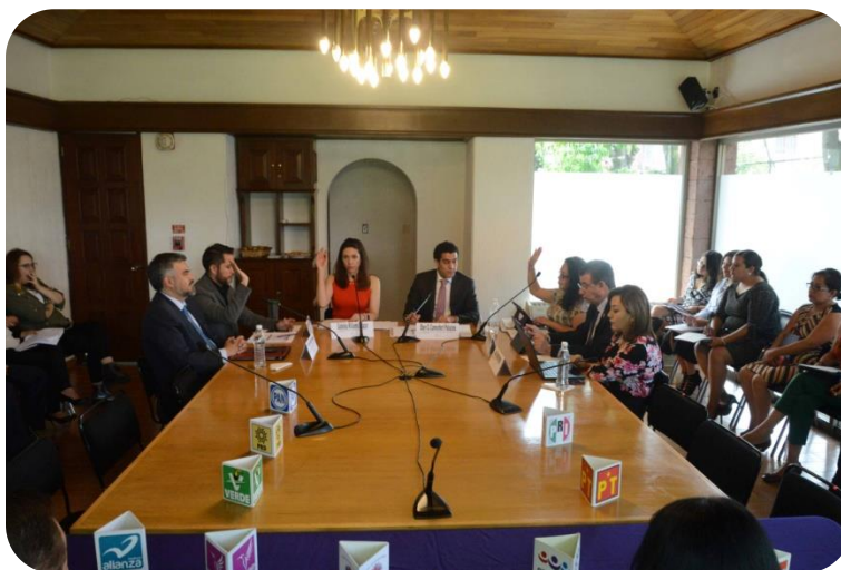
5ª. Sesión Ordinaria de la Comisión Permanente de Igualdad de Género y Derechos Humanos