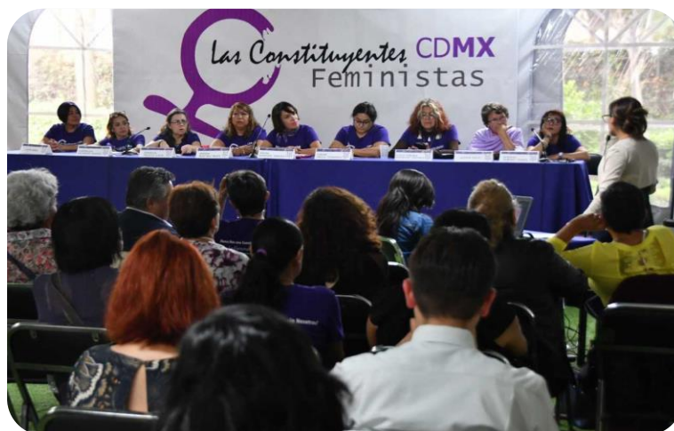
Presentación de la “Agenda Política Feminista 2018”

El colectivo Las Constituyentes CDMX Feministas, presentaron su “Agenda Política Feminista 2018”, en las instalaciones del IECM, con el fin de contribuir a generar procesos de diálogo para poner en el centro del debate político-electoral los problemas específicos que afectan a las mujeres de la Ciudad de México, ante la coyuntura del Proceso Electoral Ordinario Local 2017-2018. Acudieron un total de 54 personas; 47 mujeres y 7 hombres.