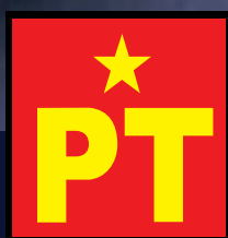
Omar García Harfuch