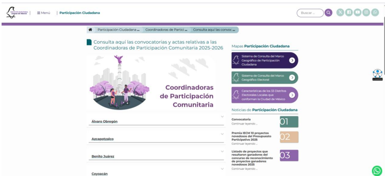
Imagen 5. Difusión de las sesiones de las Coordinadoras de Participación Comunitaria