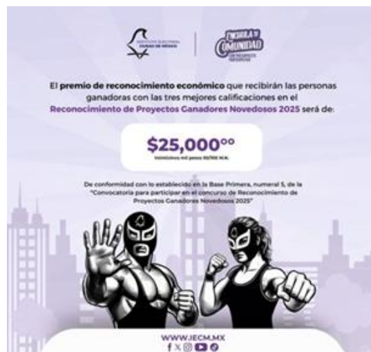
Imagen 4. Monto otorgado a los proyectos ganadores