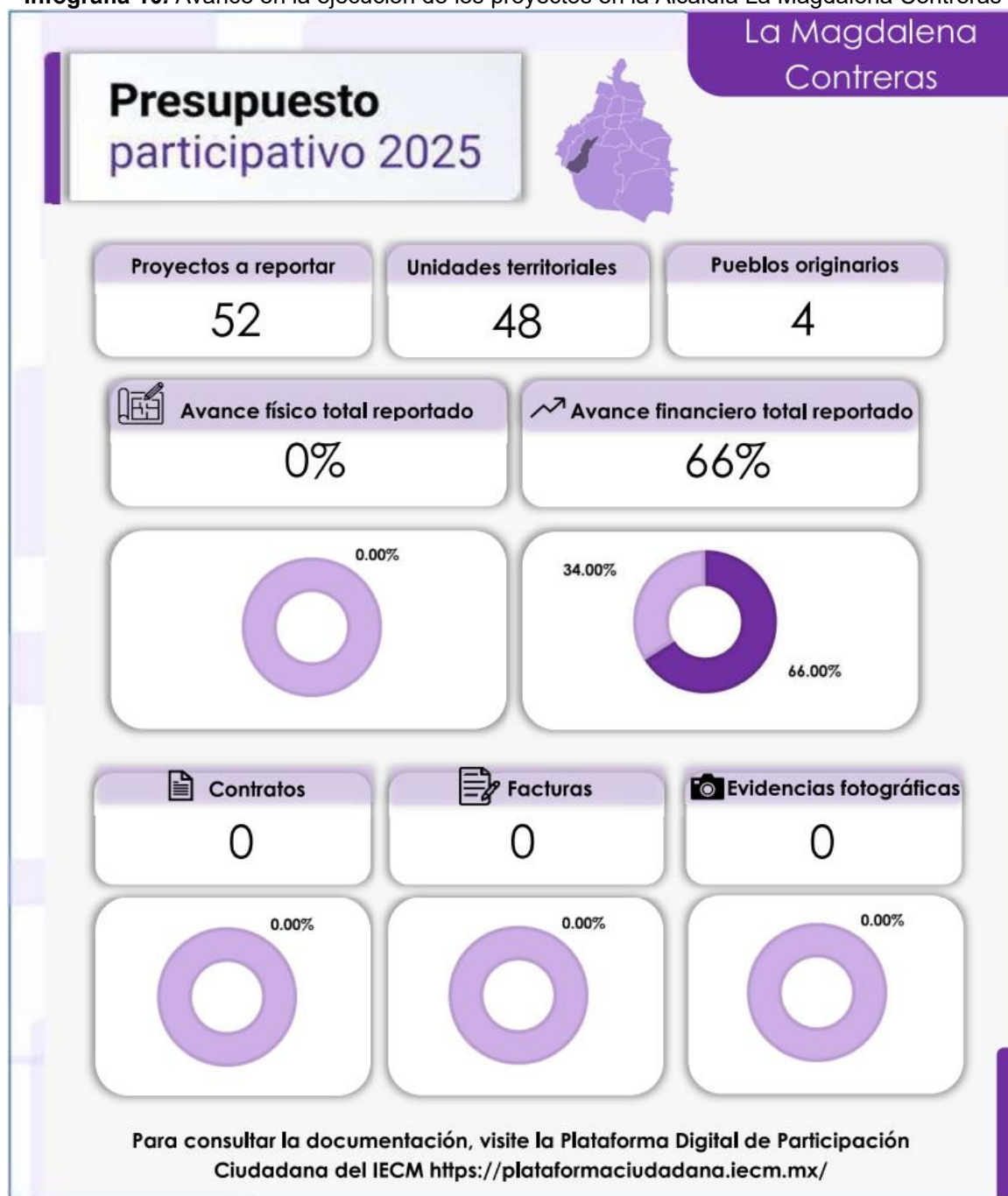
Infografía 10. Avance en la ejecución de los proyectos en la Alcaldía La Magdalena Contreras

Fuente: Elaborado con información proporcionada por la Alcaldía La Magdalena Contreras.