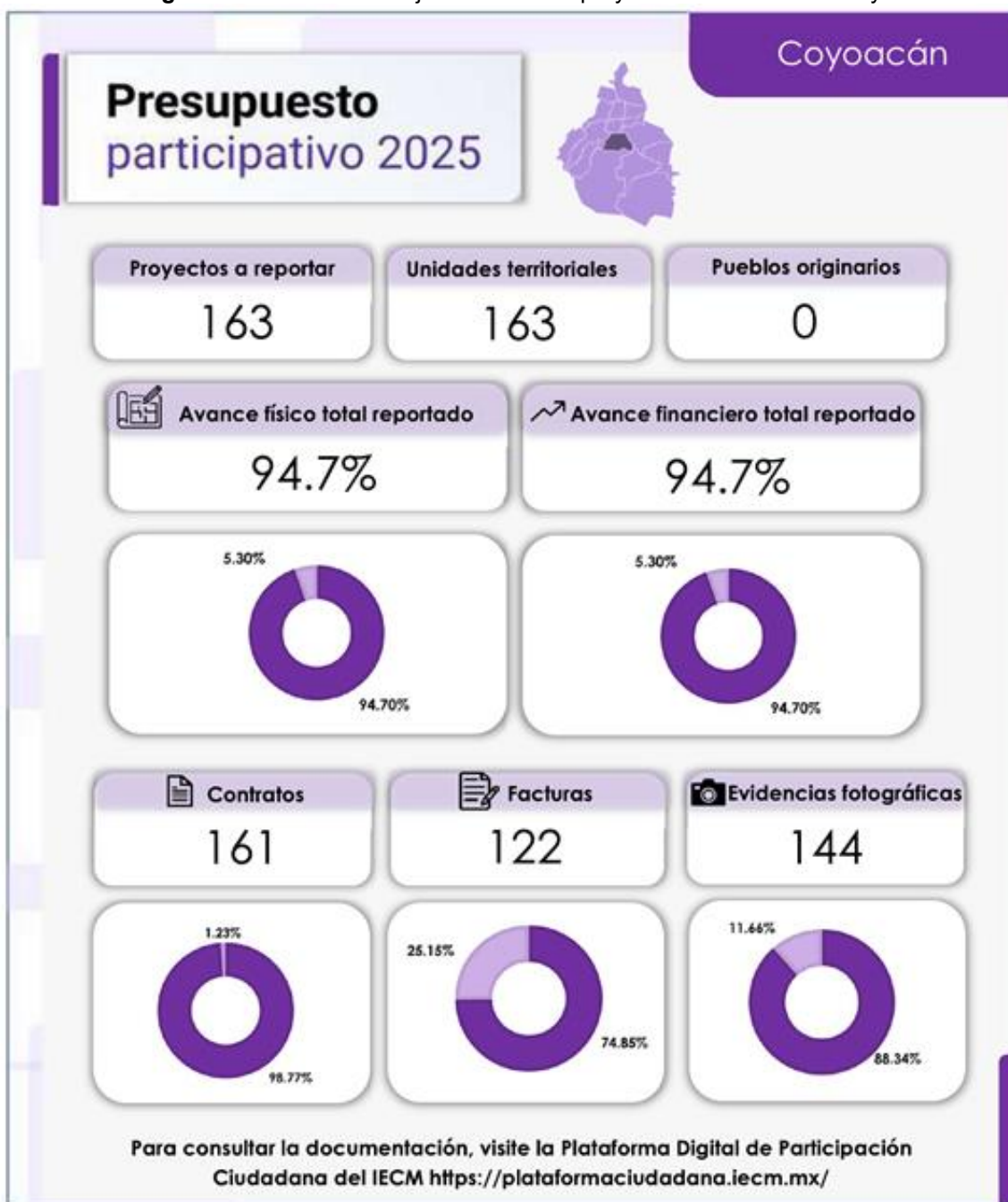
Infografía 4. Avance en la ejecución de los proyectos en la Alcaldía Coyoacán

Fuente: Elaborado con información proporcionada por la Alcaldía Coyoacán.