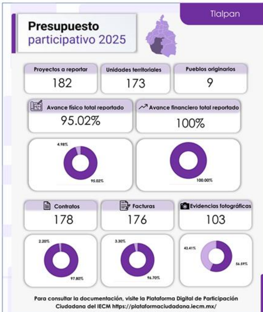
Infografía 14. Avance en la ejecución de los proyectos en la Alcaldía Tlalpan