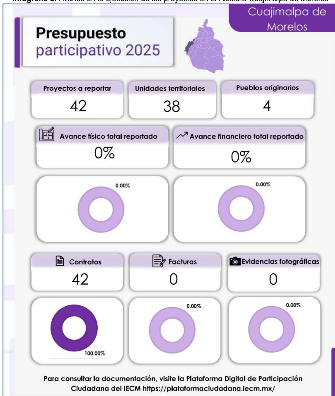
Infografía 5. Avance en la ejecución de los proyectos en la Alcaldía Cuajimalpa de Morelos