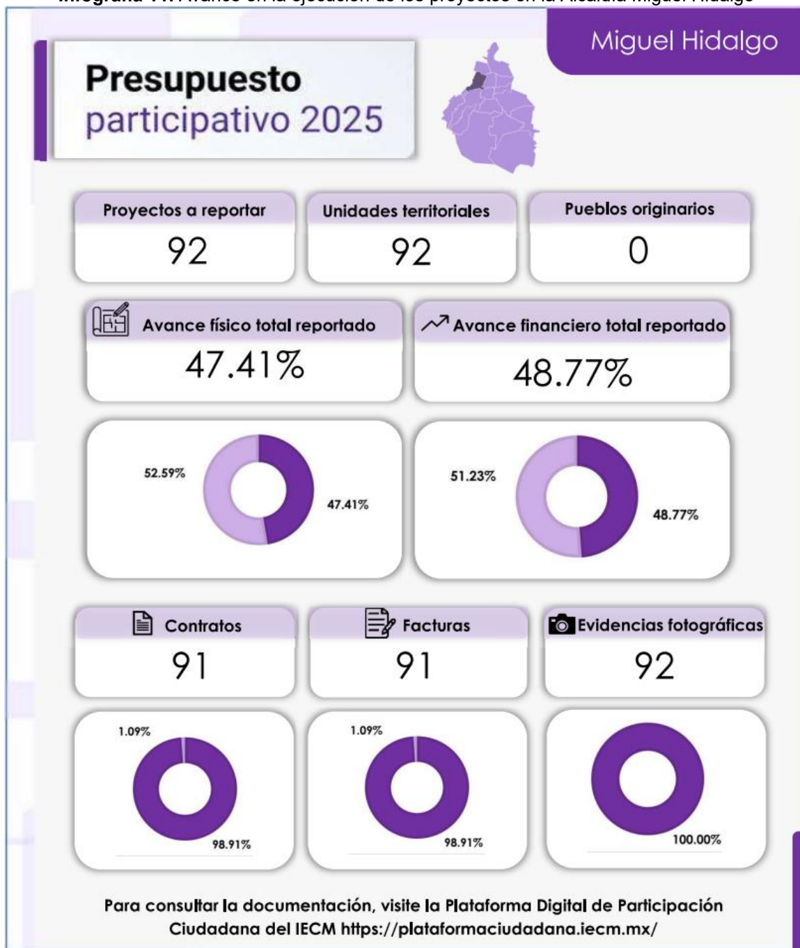
Infografía 11. Avance en la ejecución de los proyectos en la Alcaldía Miguel Hidalgo