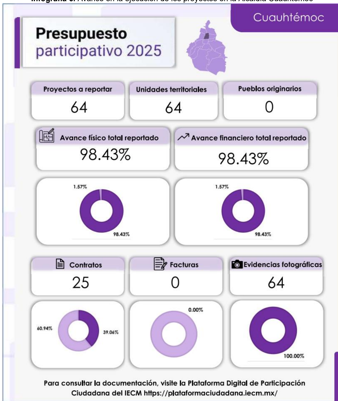
Infografía 6. Avance en la ejecución de los proyectos en la Alcaldía Cuauhtémoc