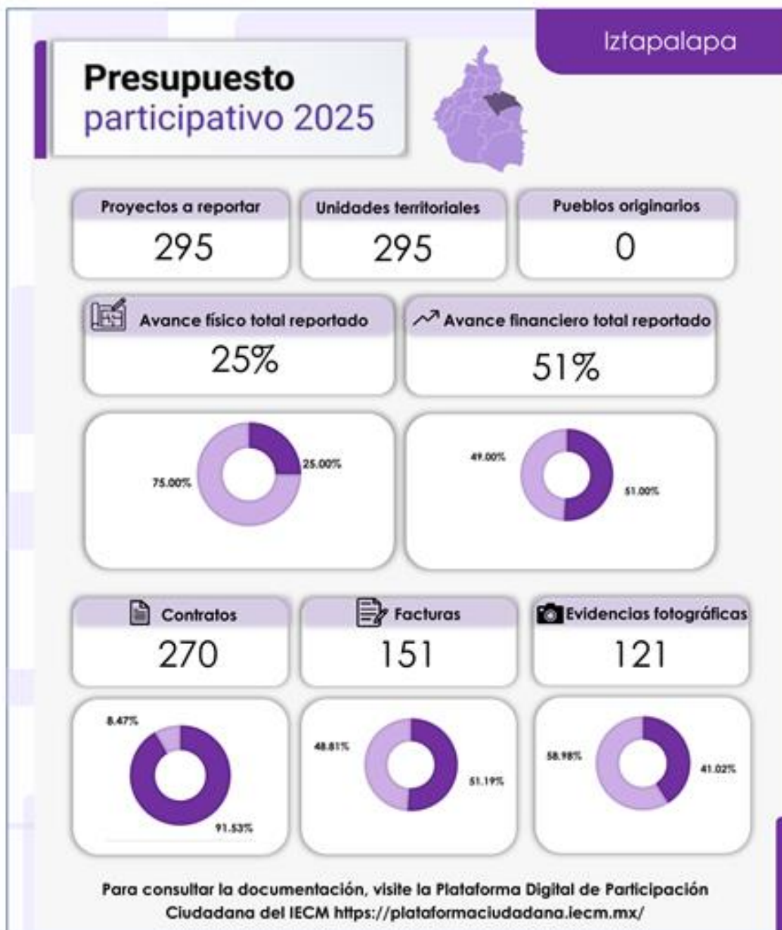
Infografía 9. Avance en la ejecución de los proyectos en la Alcaldía Iztapalapa