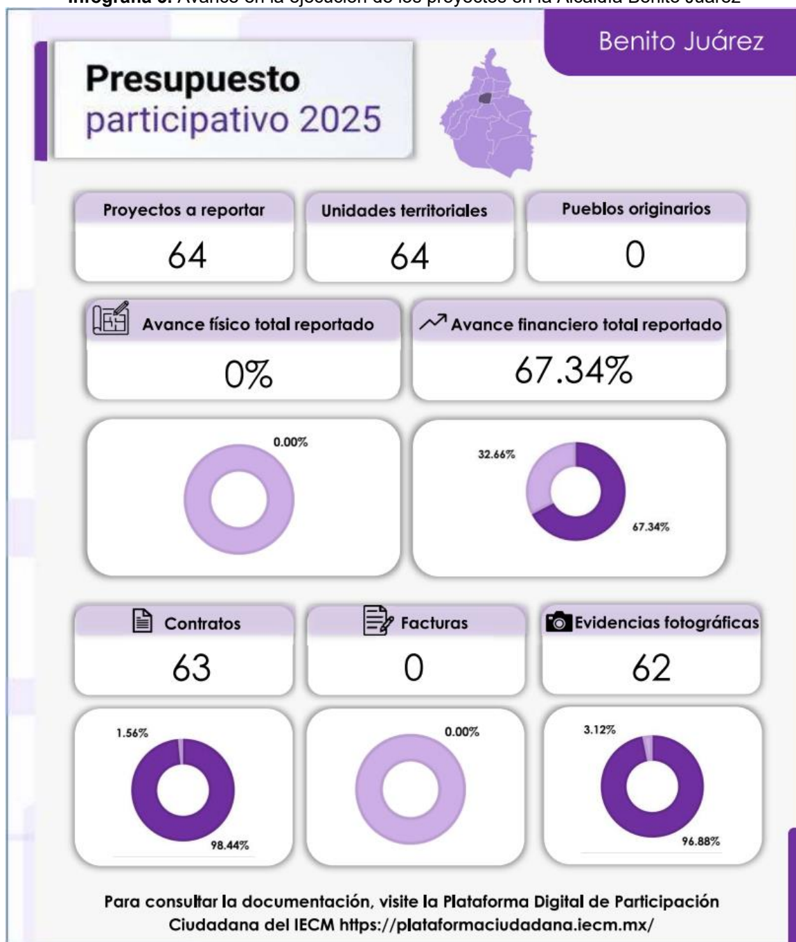
Infografía 3. Avance en la ejecución de los proyectos en la Alcaldía Benito Juárez