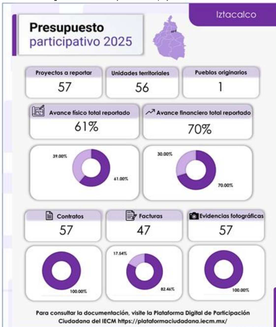
Infografía 8. Avance en la ejecución de los proyectos en la Alcaldía Iztacalco