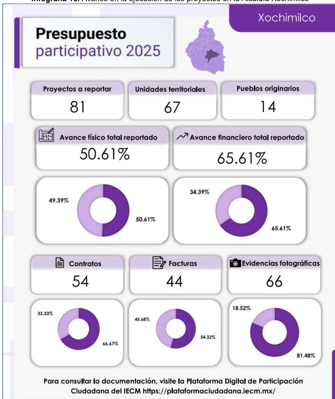
Infografía 16. Avance en la ejecución de los proyectos en la Alcaldía Xochimilco