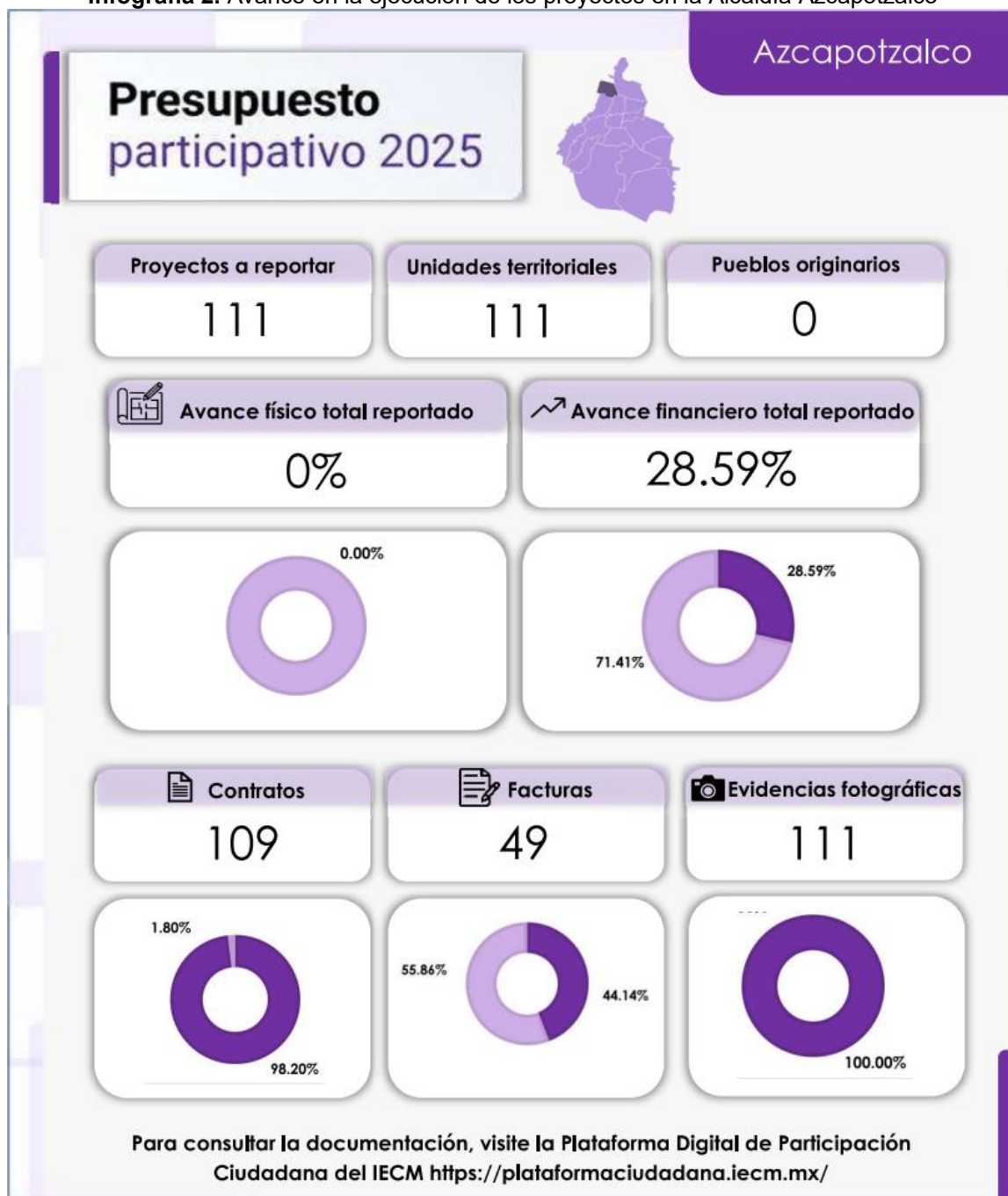
Infografía 2. Avance en la ejecución de los proyectos en la Alcaldía Azcapotzalco