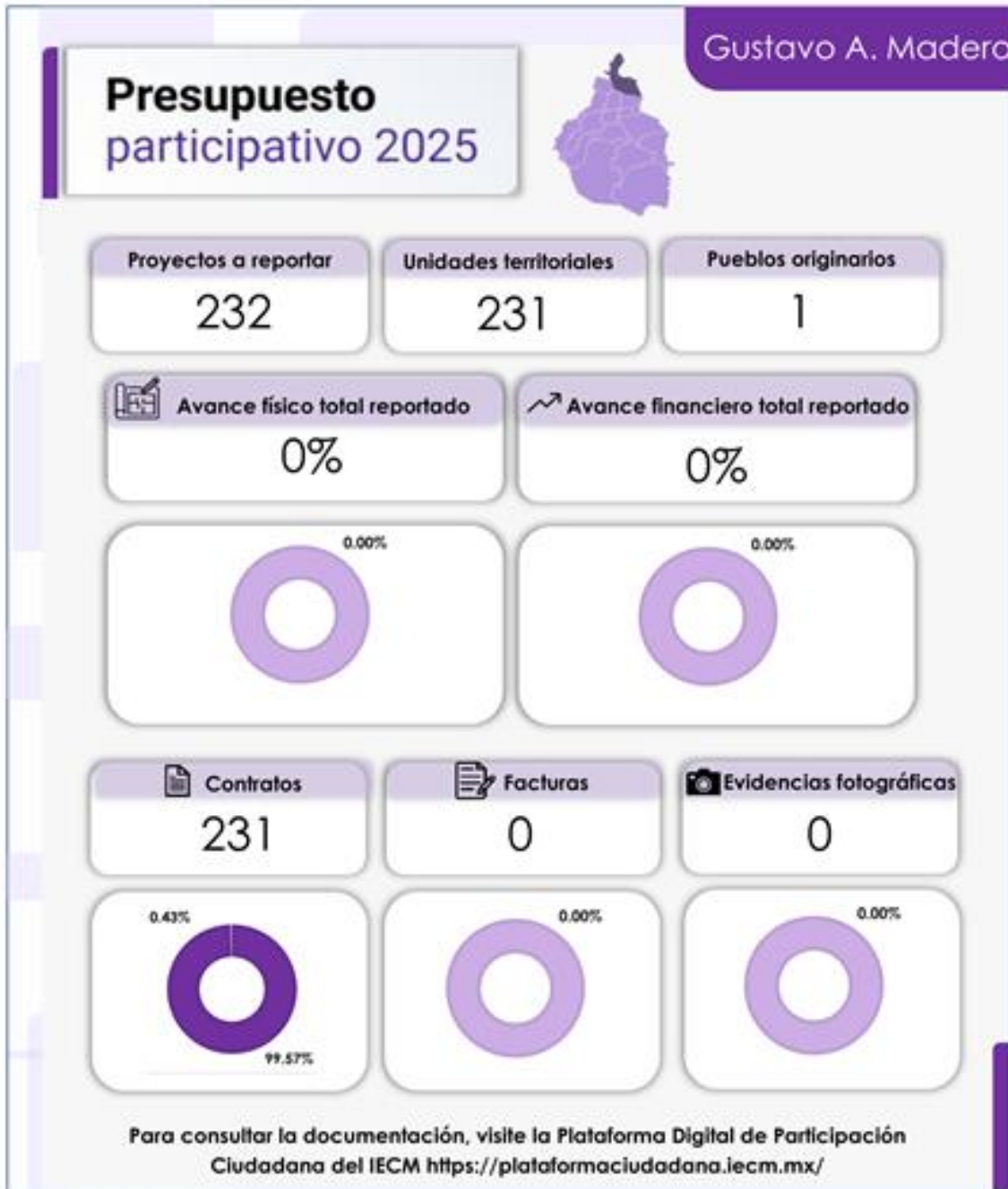
Infografía 7. Avance en la ejecución de los proyectos en la Alcaldía Gustavo A. Madero

Fuente: Elaborado con información proporcionada por la Alcaldía Gustavo A. Madero.