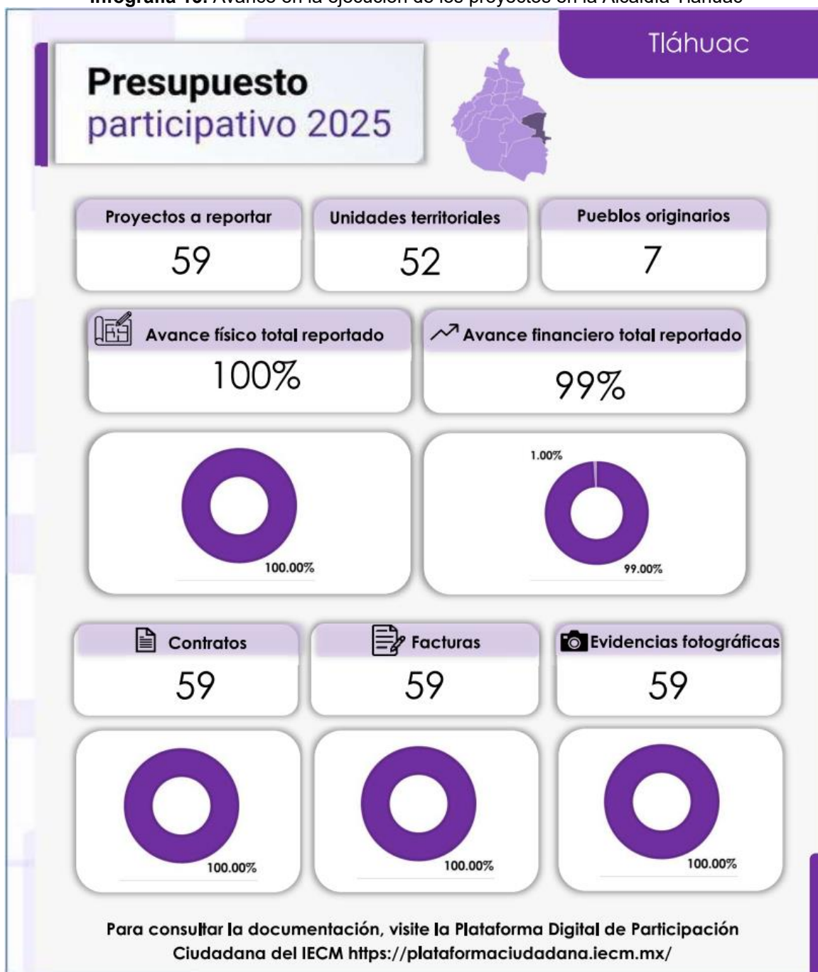
Infografía 13. Avance en la ejecución de los proyectos en la Alcaldía Tláhuac