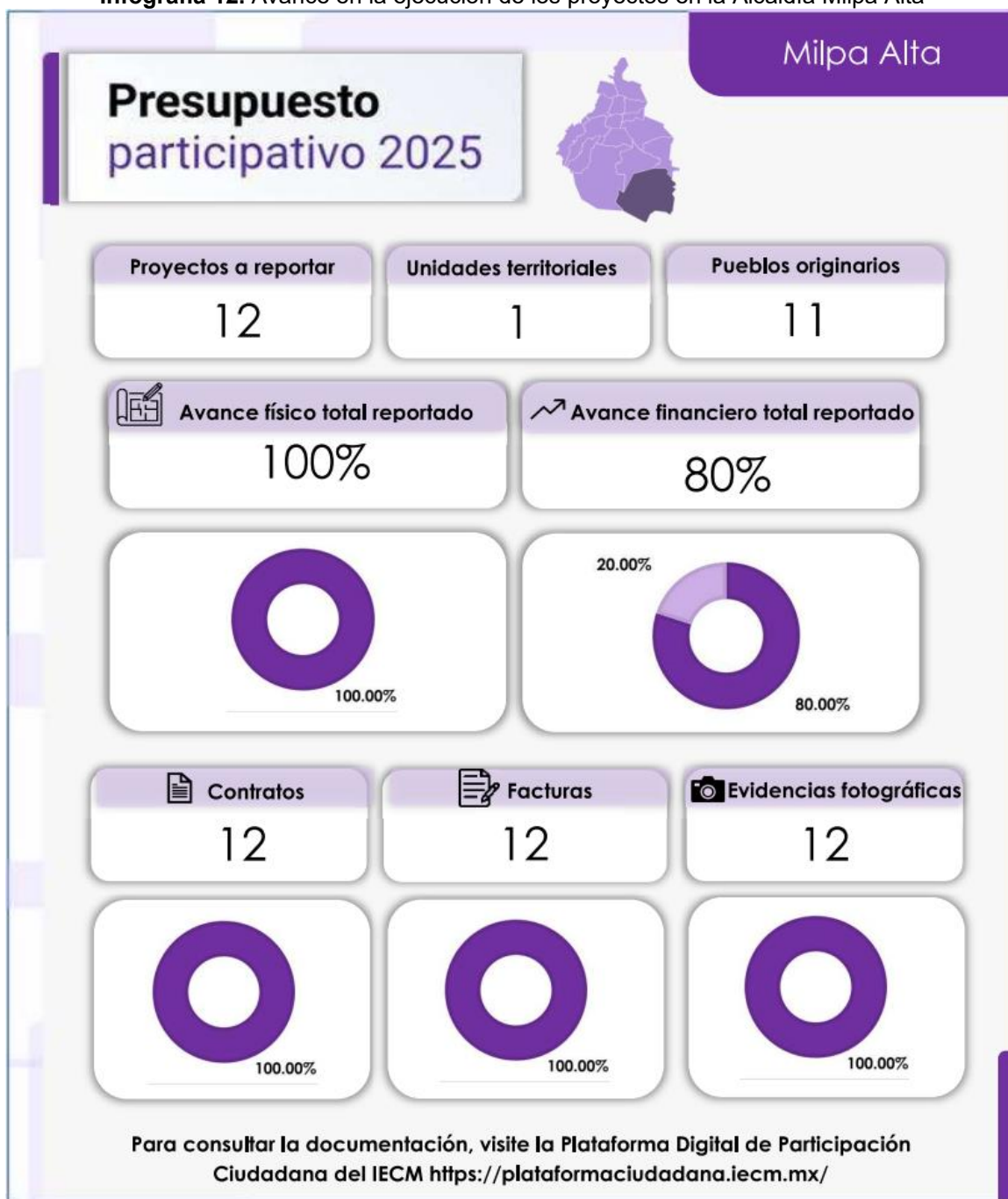
Infografía 12. Avance en la ejecución de los proyectos en la Alcaldía Milpa Alta