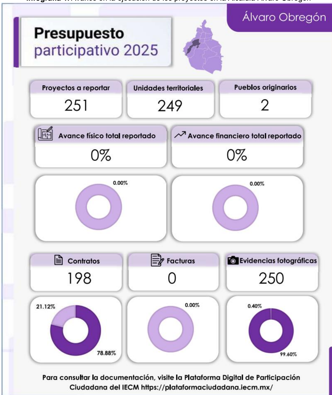
Infografía 1. Avance en la ejecución de los proyectos en la Alcaldía Álvaro Obregón