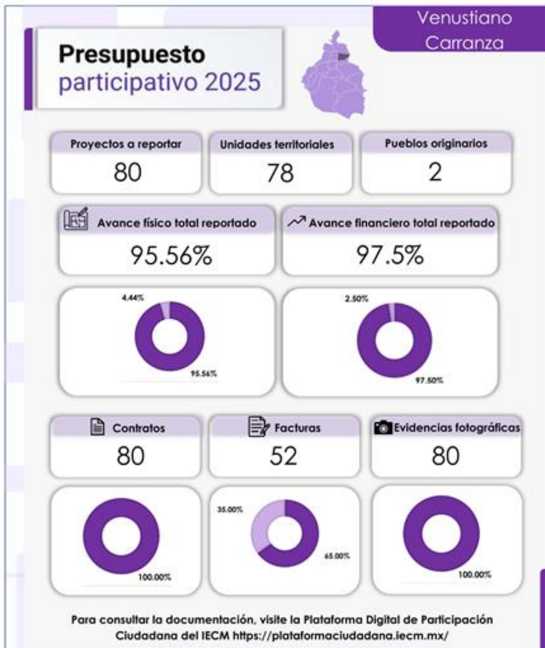
Infografía 15. Avance en la ejecución de los proyectos en la Alcaldía Venustiano Carranza