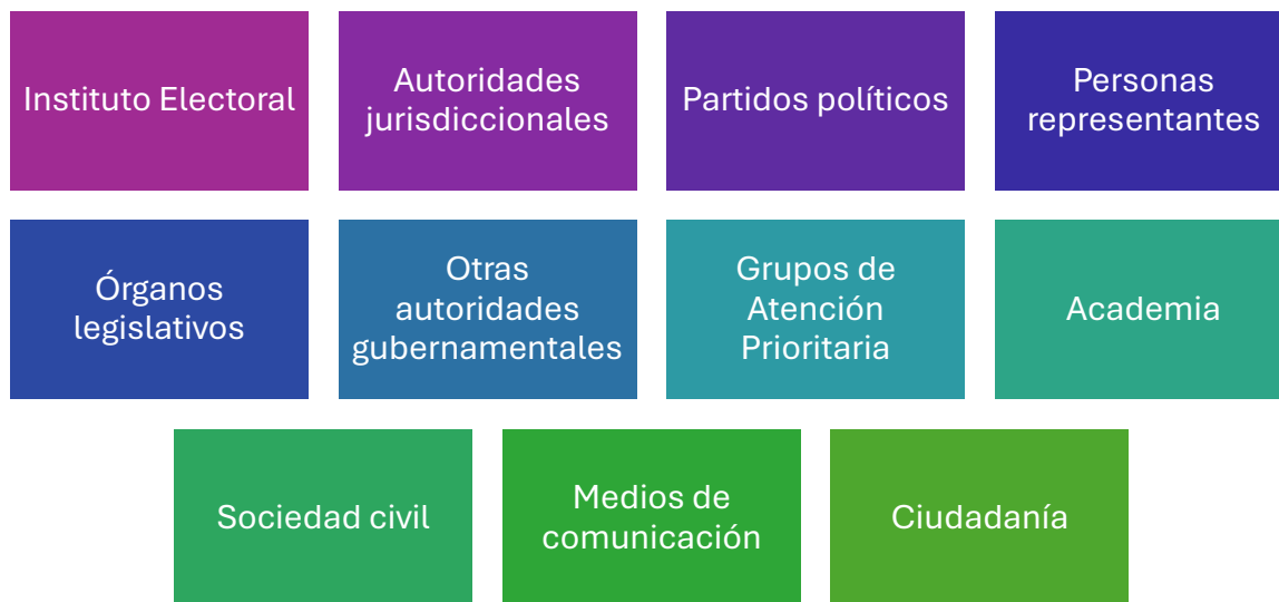
Figura 1 Instancias interesadas en acciones afirmativas

Asimismo, constituyen un referente para los GAP, la academia, la sociedad civil, los medios de comunicación y la ciudadanía en general interesada en el fortalecimiento de la participación y representación política incluyente.